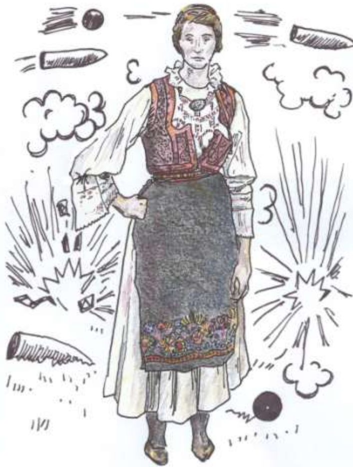
« Femme en costume traditionnel serbe dans le No man's land ». Dessin de Honza Sudek.

Centre d'études slaves 9, rue Michelet, 75006 Paris